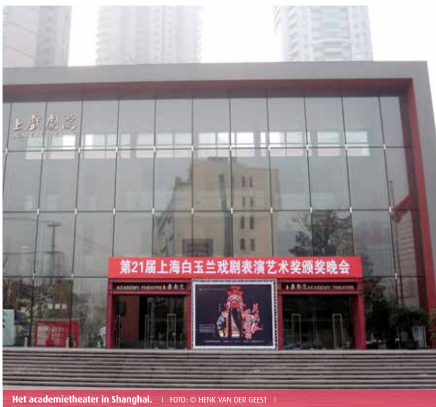
Het academietheater in Shanghai.