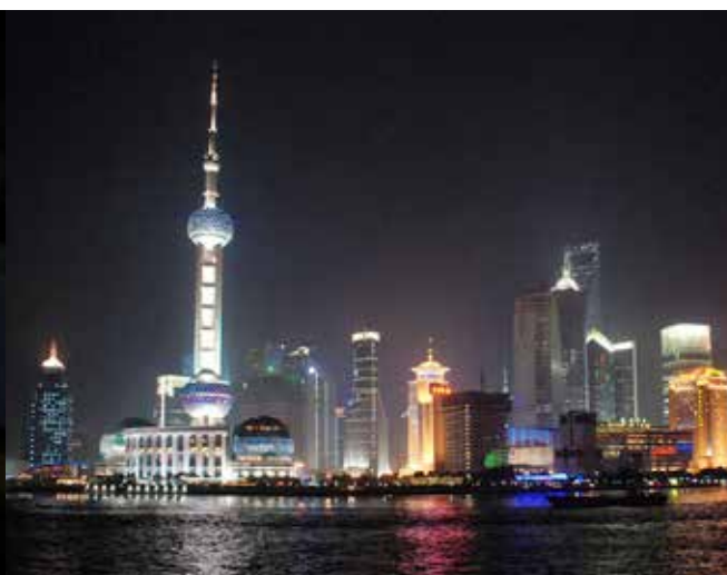
De dagelijkse lichtshow bij de rivier The Bund.